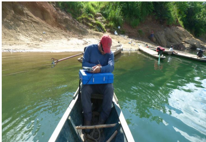
Especialista ambiental tomando nota de los registros en el puerto Segakiato.