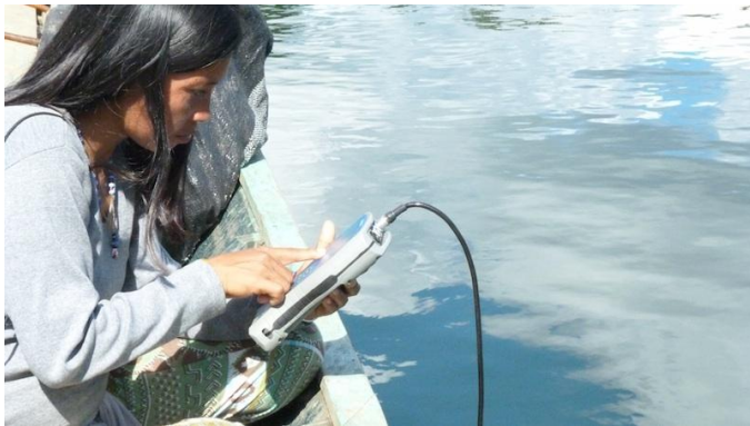
Monitora de la comunidad de Segakiato participando en el registro de parámetros físicos sobre el río Camisea